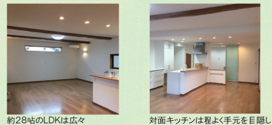
約28帖のLDKは広々 対面キッチンは程よく手元を隠し