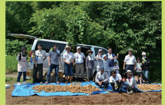
(去年の収穫の様子)

去年は猛暑の中、みんな で汗だくになりながら、大きな じゃがいもをいっぱい掘り、 ホクホクの収穫祭でした！ 今年も豊作を願いながら、 参加者を募集いたします。 初めての方も、大歓迎です。